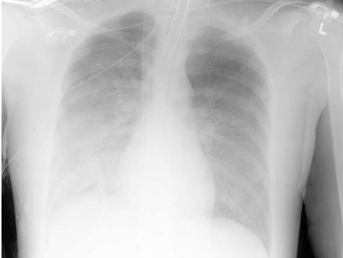
Xthorax bij aanvang ECMO