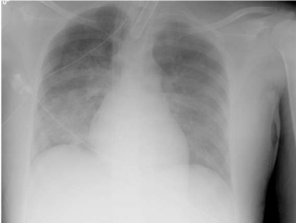
Xthorax Halverwege ECMO